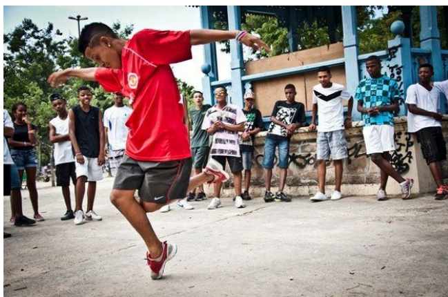
La Bataille du Passinho