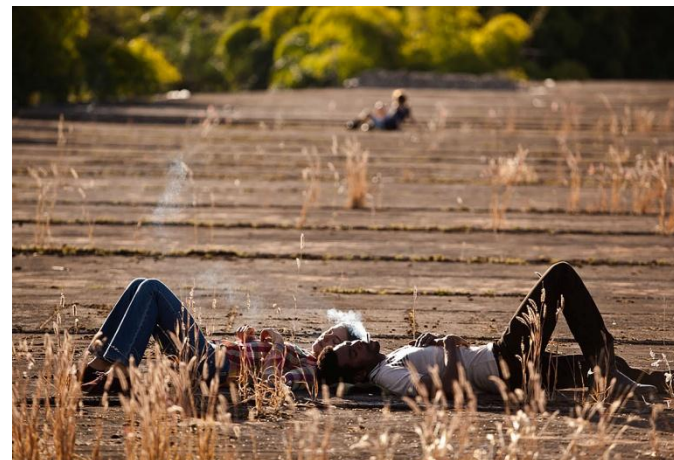
Far West Brésilien

Un Loup derrière la Porte de Fernando Coimbra