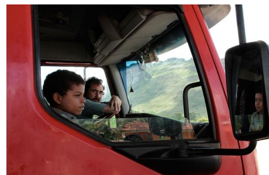
Au Bord du Chemin