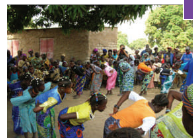
Les activités de concertation sont aussi l'occasion de fêtes populaires

Par ailleurs, cet axe transversal a pour objectif de contribuer au plaidoyer national autour des politiques à développer dans le cadre de ces thématiques. Le PAIDEL CT encourage les témoignages des partenaires et des acteurs régionaux par des rencontres , des voyages d'études , des émissions de radio (près d'une 30 aine pour l'ensemble de l'action), des reportages filmés , des sites-web , etc.