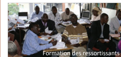
Formation des ressortissants

La co-opération décentralisée , par l'accompagnement des associations de ressortissants afin qu'ils jouent pleinement un rôle de « passerelle » entre leur collectivité territoriale en Europe et leur collectivité territoriale d'origine.