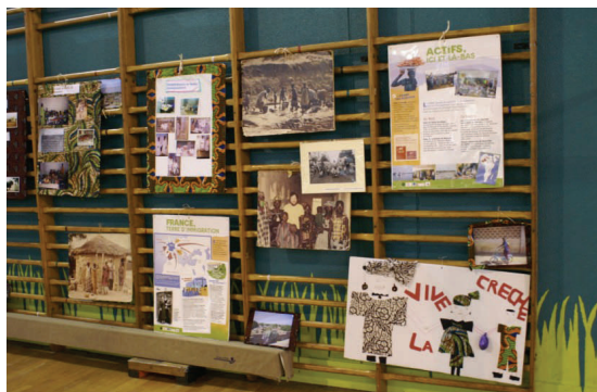
Exposition sur le « double-espace » en France