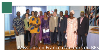
Missions en France d'acteurs du BFS

Les dix ans d'expérience du PAIDEL sont mis à profit pour accompagner les partenaires du programme dans la mise en place effective de dispositifs mutualisés fournissant des services adaptés aux besoins des collectivités territoriales et des acteurs locaux dans les domaines suivants : diagnostic de territoires, animation territoriale pluri-acteurs, planification concertée, mobilisation et diversification des ressources locales, co-opération territoriale.