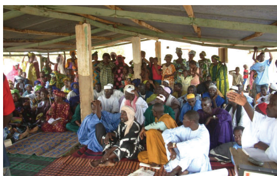
Des participants attentifs lors de l'élaboration d'un plan d'actions prioritaires (PAP)