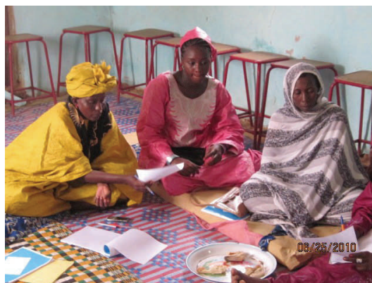
Des membres du cadre de concertation de la commune de Lexeiba (Mauritanie)