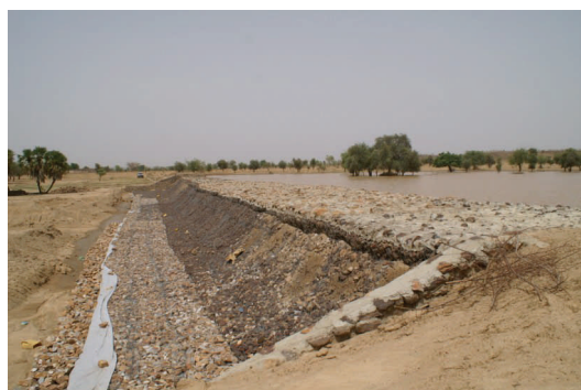
Barrage dans les environs de Bakel (Sénégal)

Fort de cette expérience, le PAIDEL est entré dans une seconde phase (2007-2009) visant à élargir le champ géographique de son intervention et à aborder des problématiques complémentaires : la co-opération territoriale, le co-développement et le développement économique .