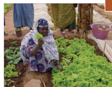
Le maraichage, une activité très appréciée des femmes de la sous-région

Par la construction d'infrastructures et la mise en place de services de base, les collectivités ont démontré leurs capacités à prendre des initiatives. Il est toutefois nécessaire d'aller plus loin : « à quoi nous sert ce dispensaire si nous n'avons pas d'argent pour payer les médicaments ? ». Pour y contribuer, la troisième phase du PAIDEL accompagne les collectivités et les acteurs locaux dans la conception de stratégies de développement économique . Les documents cadres qui en découleront, au niveau des territoires ou des filières porteuses, feront ressortir les besoins techniques et financiers des porteurs de projets économiques . Ces entrepreneurs se verront alors proposer des solutions adaptées mises en place par les partenaires du programme.