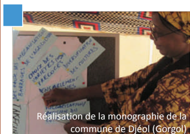
Réalisation de la monographie de la commune de Djéol (Gorgol)