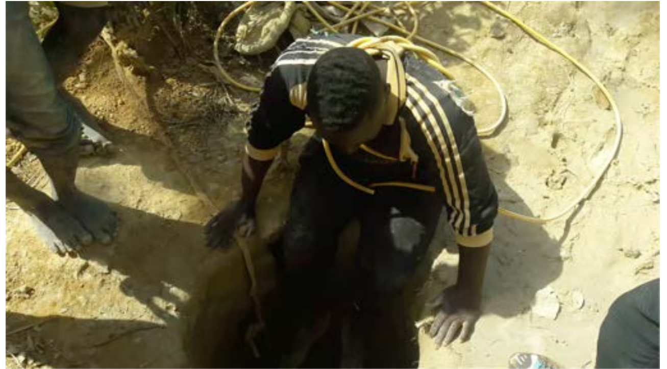
Miniers « sous-marins », Diatéla (Siguiri), 2017