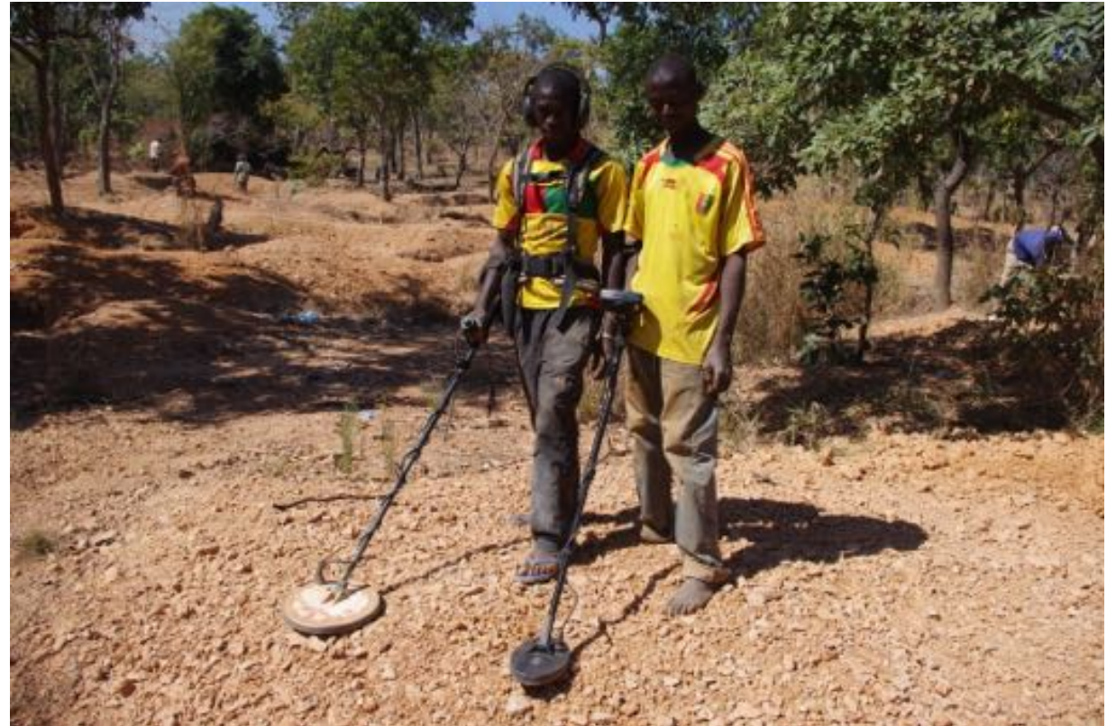
Détecteurs de métaux et accroissement des mobilités, Kourémalé, 2013

→ Femmes toujours présentes sur les sites mais de moins en moins des épouses d'orpailleurs ou orpailleuses mobiles, et de plus en plus des femmes originaires du village propriétaire d'exploitation.