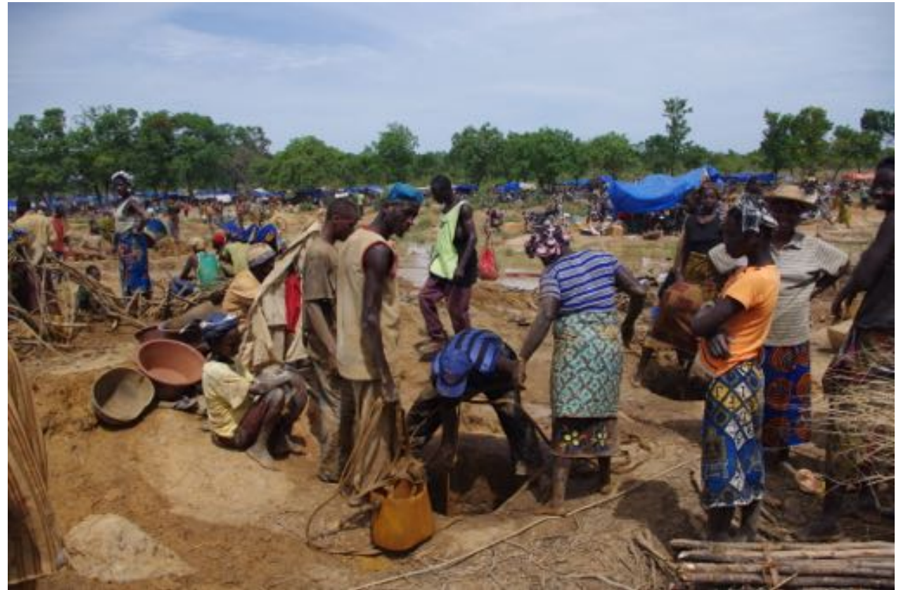
Terrain d'exploitation et campement, Falako (Mandiana), 2011