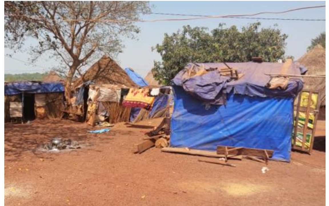
Abris de fortune d'orpailleurs au sein d'un village minier, Banjoula, Guinée, 2019