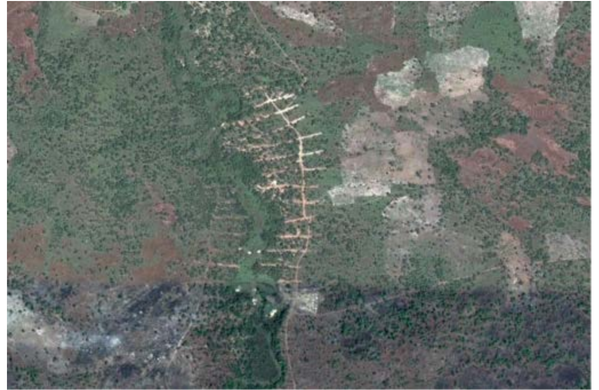
Lignes de prospection en Haute-Guinée, vue Google Earth, 2019

→ Relations d'emblée biaisées entre orpailleurs et personnel de compagnies minières