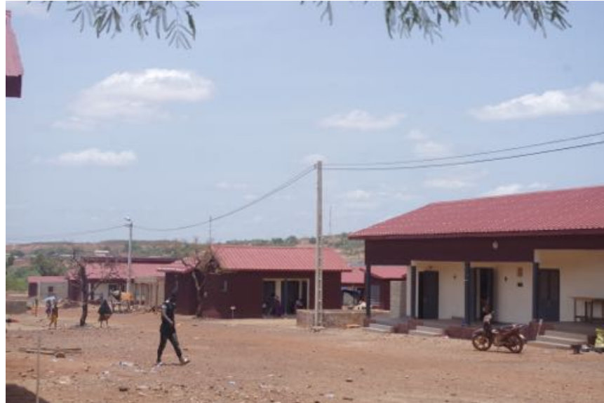
Quartier de relocalisation d'habitants à Kintinian, Guinée

Enjeu de formalisation des terres et de l'urbanisation ou comment les mines introduisent de nouvelles manières de faire espace, entraînant pas exemple la judiciarisation des conflits