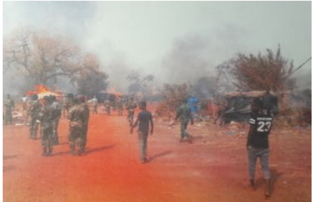
Destruction d'un campement dans le cadre d'une mission de déguerpissement, Doko, Guinée