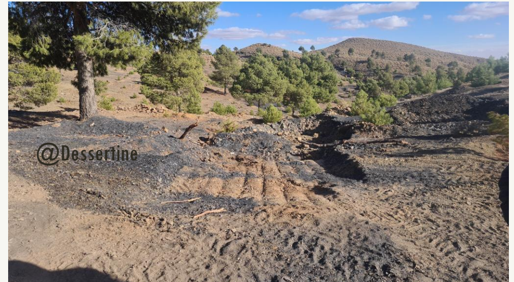
Puits informel bouché, Jerada, 2021