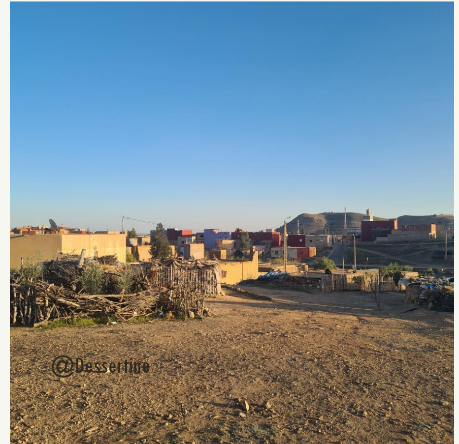
Quartier périphérique de Hassi Blal, Jerada, 2021