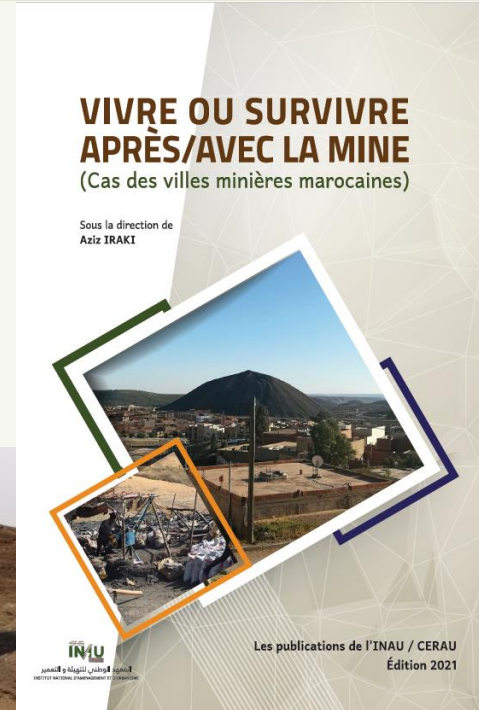
Puits informels et dépôt de charbon, Jerada, 2019